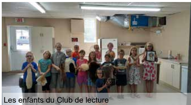
Les enfants du Club de lecture