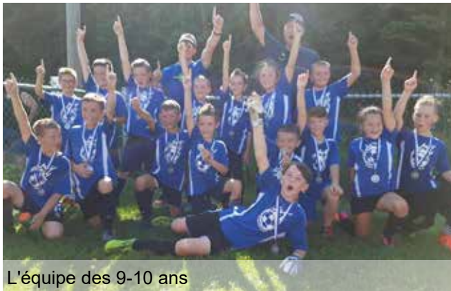
L'équipe des 9-10 ans