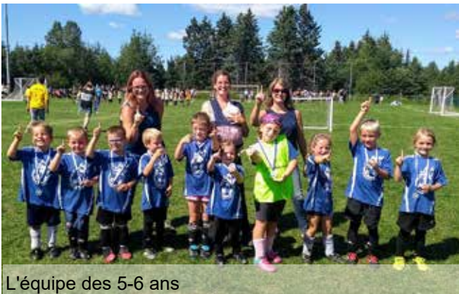
L'équipe des 5-6 ans

Le tournoi de fin de saison au soccer se déroulait du 22 au 25 août dernier et nous désirons féliciter l'ensemble des participants pour leurs efforts.