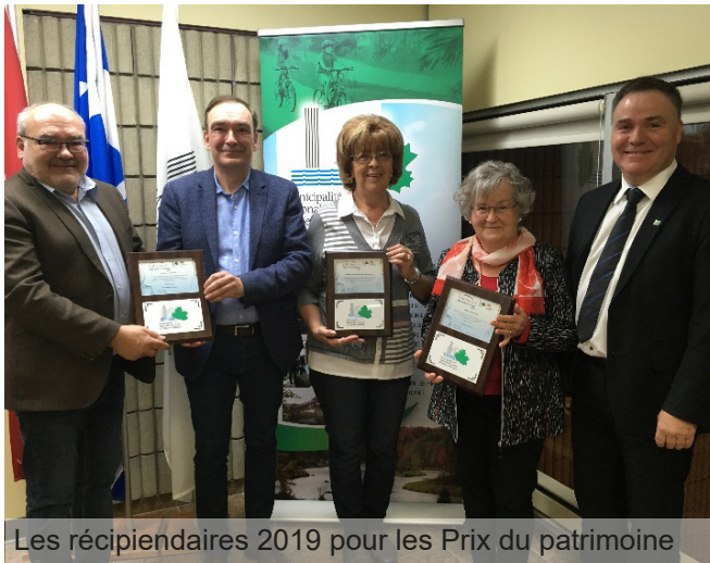
Les récipiendaires 2019 pour les Prix du patrimoine

La MRC de Beauce-Sartigan a dévoilé, le 16 mai dernier, les lauréats de la 8 e édition des Prix du patrimoine.